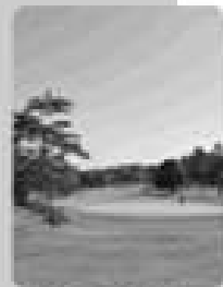
北海道ゴルフ倶楽部(旭川)